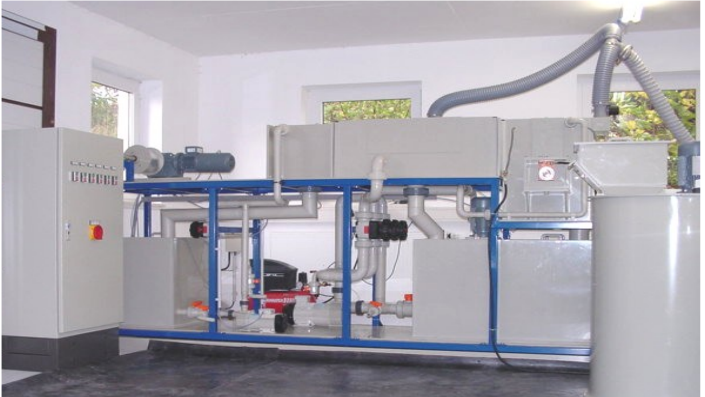
Abbildungen: Versuchsträger zum Testen eines neuen Verfahrens zur Horizontalabscheidung von Bleiband

Die ERO GmbH Anlagenbau entwickelt, konstruiert und fertigt im Rahmen ihrer FuE-Tätigkeit Anlagen zur Realisierung neuer galvanotechnischer Verfahren.